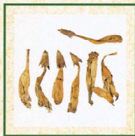
紫葳科 凌霄花 《中醫藥條例》 附表2中藥材*

*《中醫藥條例》附表1內包括31種毒性中藥材，須經註冊中醫處方才可購買；附表2則包括574種香港常用的中藥材。