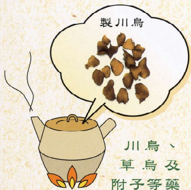
川烏、 草烏及 附子等藥 材的生品只可外用， 炮製品內服時要先煎 及久煎