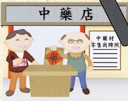
到持牌的中藥店購買中藥