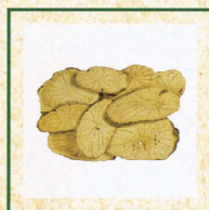
馬兜鈴科 廣防己 (已於2004年 6月1日禁止在 香港銷售)