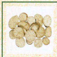
防己科 防己 《中醫藥條例》 附表2中藥材*