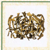
茄科 洋金花 《中醫藥條例》 附表1中藥材*