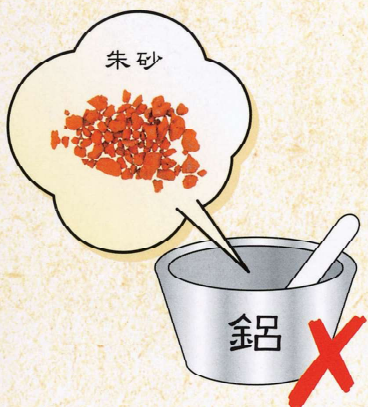
朱砂不可用 鋁製器具研末

中藥須用正確的方法煎煮，以發揮藥效及減低個別藥材的毒性和副作用。因此，要遵照中醫師的煎煮指示，以免煎煮不當導致不良反應。